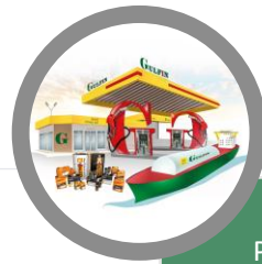
Distribution de Produits Pétroliers